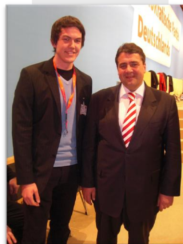
Jonas Maurer mit dem Parteivorsitzenden Sigmar Gabriel

In allen Ländern, in denen Sozialdemokraten keine Regierungsverantwortung tragen, mangelt es an drei Dingen: Freiheit, Gerechtigkeit und Solidarität. Deshalb müssen wir Schwarz-Gelb auf die Oppositionsbänke zurück verweisen. Im Gegensatz zu anderen Parteien setzt die SPD nicht auf Konzepte von gestern – sie ist auf der Höhe der Zeit und sturmerprobt seit 1863!“