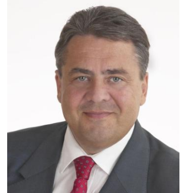
Sigmar Gabriel, Parteivorsitzender

In diesem Jahr gibt es gute Gründe, für eine starke SPD zu streiten. Ob Soziales, Gesundheit oder Verbraucherschutz: Die schwarz-gelbe Koalition bedient weiter ihre reiche Klientel zulasten der Mitte unserer Gesellschaft. Die SPD wird gebraucht, um deutlich zu machen. Es