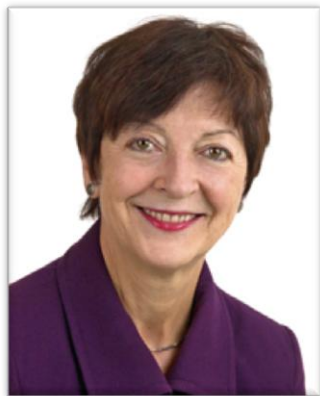
Elvira Drobinski-Weiß, MdB und Kreisvorsitzende

Elvira Drobinski-Weiß (EDW): Es ist tatsächlich kein Gesamtkonzept in der Verkehrspolitik der aktuellen Landesregierung erkennbar. Das Zauberwort lautet aber: Intelligente Verkehrslösungen, bei denen alle Transportmittel vernetzt und aufeinander abgestimmt werden. Davon und von einer emissionsfreien Mobilität ist die Planung der aktuellen Landesregierung aber noch weit entfernt.